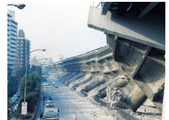
倒壊した阪神高速道路

お住いの家が、1981年6月より前の確認申請で建てられたものであれば、現在の水準から言えば「地震に弱い家」に分類されます。既存の住宅の耐震診断は、旧耐震基準以前に建てられた建物に対して行われますので実施することをおすすめします。1995年1月には阪神淡路大震災が発生。古い木造住宅の密集する地域では大量の倒壊と火災も発生、消防車は近寄れず。インフラは機能せず、死者6400人超、68万棟以上が倒壊や焼失しました。