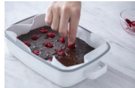
【フランボワーズガトーショコラ】のレシピは以下のQRコードから。

シンプルで存在感のある佇まいが心くすぐるホーローアイテム。今回は、スタイリッシュだけでなくサステナブルなホーロー容器の魅力をご紹介します。皆さんは、食品の保存容器は何を使っていますか？