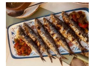
安価で美味しいイワシ

血糖値を比べると、35%群は15%群より低く、45%群は15%群と差がありませんでした。少ないタンパク質摂取を穀物などから補うための多食が肝臓や血糖値に悪影響を及ぼしていると言えます。アフリカなどの貧しい国の多くがタンパク質を穀物に依存しているのと同様の現象です。肝臓の中性脂肪や血糖値から見て25~35%の食事が健康的と言えそうです。魚・鶏卵・大豆などのタンパク質を積極的にとりましょう。